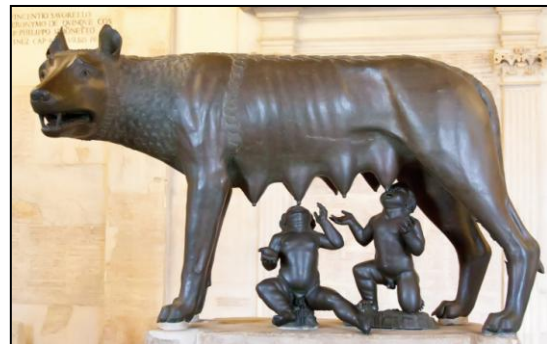
Antike Bronzestatue der Kapitolinischen Wölfin, die Romulus & Remus, die mythischen Gründer der Stadt Rom, säugt

erster Linie: ein Werkzeug zum Erhalt der biologischen Vielfalt unter Einbeziehung der Menschen. Mit Hilfe von Natura 2000 können Natur und Menschen zusammengebracht werden – der Mensch und die Natur müssen als Eins existieren. Denn eine Trennung ist der gravierendste Fehler schlechthin – die Wurzel allen Übels. Ähnlich verhält es sich mit den Staaten in Europa – wir müssen zusammen leben und arbeiten.