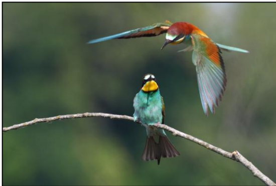
Die Bienenfresser sind nach Rom zurückgekehrt!

Heute hat dieser Traum von Europa einen schweren Stand. Es fühlt sich so an, als wären wir in eine Sackgasse geraten. Wir leben in einer Zeit in der wir – mehr als je zuvor - die kollektive Intelligenz der Politiker, Bürger und der zivilgesellschaftlichen Gruppen in Europa benötigen. Europa hat große Fehler begangen, einer war, dass es zu langsam erkannt hat, dass das Projekt Europa nicht ausschließlich mit Kohl und Stahl oder durch Bankgeschäfte am Leben gehalten werden kann, sondern dass wir auf unserem gemeinsamen kulturellen, philosophischen und natürlichen Erbe aufbauen müssen. Trotz dieser Einschränkungen war Europa unbestritten etwas Gutes, ein Bewahrer des Friedens und Verteidiger vor Umweltzerstörung.