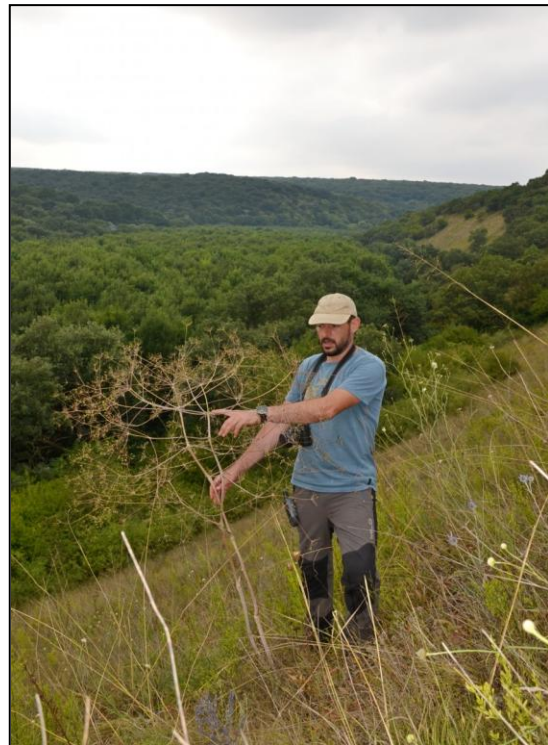
Ferula mikraskythiana

Diese Neuentdeckung gehört zur Familie Apiaceae – eine große Familie mit mehr als 3.700 Arten zu denen hauptsächlich sehr aromatische Blütenpflanzen zählen, einschließlich einiger Arten die aus der Küche bekannt sind wie Sellerie, Karotten, Petersilie, Korinader, Dill und Fenchel. Der spezifische Beinamen dieses neuen Mitgliedes der Familie Apiaceae bezieht sich auf den antiken griechischen Namen der historischen Region Scythia Minor oder Lesser Scythia (Μικρά Σκυθία), wo diese Art gefunden wurde. Diese Region ist heute unter dem Namen Dobrogea bekannt. Die nächste verwandte Art ist Eriosynaphe longifolia , eine seltene Art die in der Pontisch-Kaspischen Steppe der Ukraine, Süd-Russland und West-Kasachstan vorkommt. Bislang wurde angenommen, dass die zuvor genannte Art die einzige ihrer Gattung war, aber die Neuentdeckung zeigt, dass beide Arten zur Gattung Ferula zuzuordnen sind.