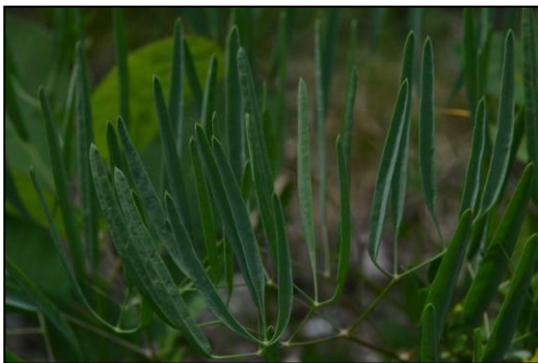
Ferula mikraskythiana

Wir stellen Ferula mikraskythiana (Apiaceae) vor, eine neue Pflanzenart, die kürzlich in Rumänien entdeckt wurde