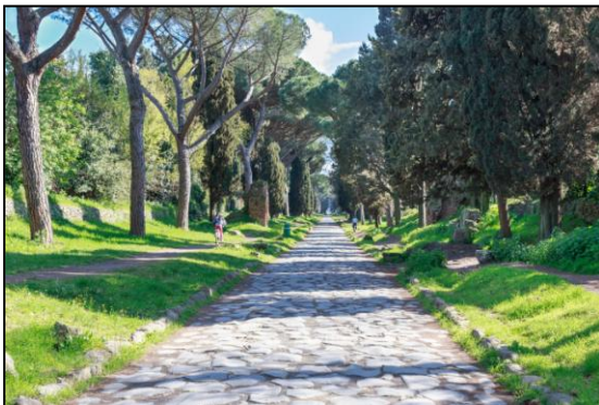
Die Via Appia in Rom

Der Generaldirektor der LIPU (BirdLife in Italien) nimmt den 60. Jahrestag der Römischen Verträge zum Anlass, um darüber nachzudenken, was das Projekt Europa für die Natur, die Vögel und die Menschen bedeutet.