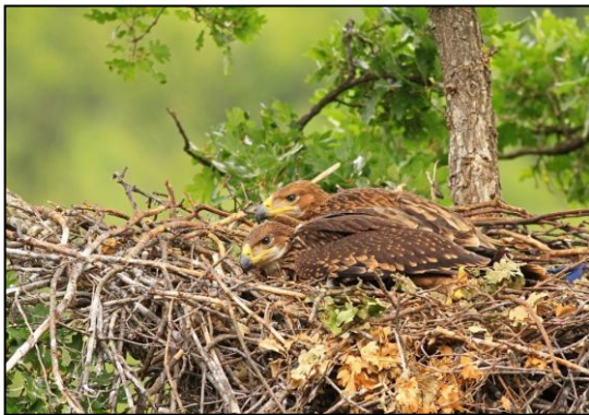
Östlicher Kaiseradler

Wenn es der Europäischen Union nicht gelingt, eine Zusammenarbeit zwischen Ländern zu fördern – wem dann? Vögel kennen keine Grenzen und unsere Naturschutzarbeit muss oft länderübergreifend ansetzen. LIFE war in der BirdLife Familie der Ansporn für eine Zusammenarbeit zwischen den BirdLife-Partnern. Ende letzten Jahres, starteten vier unserer Partner das Programm „PannonEagleLIFE: hierbei setzen sich elf Organisationen aus fünf Ländern [darunter die BirdLife Partner aus Ungarn (MME), Tschechien (CSO), Österreich (BirdLife Österreich) und Serbien (BPSSS)] für den Schutz des Östlichen Kaiseradlers ( Aquila heliaca ) in der Pannonischen Tiefebene ein. Das LIFE-Projekt hat einen Umfang von 3,5 Millionen Euro.