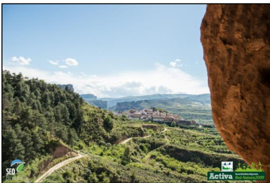
Valle del Iregua, La Rioja – Teil des Natura 2000 Netzes

Das Projekt ist nun abgeschlossen. Es ist unmöglich, hier alle Hochs und Tiefs der letzten Jahre zu beschreiben. Aber eins steht fest: Es ist uns gelungen, den Menschen das Natura 2000 – Netzwerk näher zu bringen. Wir haben den Menschen und den Behörden die Bedeutung dieses Schutzgebietsnetzes aufgezeigt und ich kann wirklich sagen, dass das Projekt die Einstellung der spanischen Bevölkerung aber auch von uns bei SEO/BirdLife verändert hat.