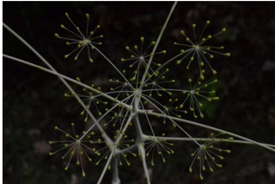
Ferula mikraskythiana

Nachfolgende Untersuchungen zeigten, dass die Art endemisch in Rumänien ist, mit einer sehr kleinen Population (172 Individuen in 2015) beschränkt auf einige wenige Steppen-Grasland Enklaven im Naturschutzgebiet Dumbrăveni Forest. Gemäß der IUCN sollte die Art daher als „gefährdet“ eingestuft werden. Der Grund, warum diese Art überhaupt überlebte, war wohl der Schutz durch das abgelegene und isolierte Naturreservat. Im restlichen Dobrogea Gebiet, gibt es aufgrund von Überweidung keine vergleichbaren Steppen-Graslandschaften mehr.