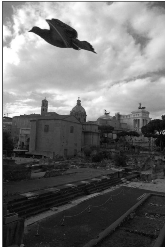
Taube über dem Forum Romanum

Ähnlich – wenn auch in viel kleinerem Maßstab – verhält es sich mit BirdLife. Wir sind ebenfalls eine Partnerschaft, eine Gruppe unterschiedlicher Menschen und Organisationen. Wir haben weltweite Ziele, setzen regional Dinge um und wir teilen gemeinsame Werte. Wir glauben an Zusammenarbeit und Dialog. Wir glauben auch daran, dass die natürlichen Ressourcen unseres Planeten ein wertvolles Erbe darstellen, das geschützt werden muss, um die Zukunft unserer Kinder und unserer Gesellschaft zu bewahren. Dies sind die Gründe, weshalb wir die Herausforderung angenommen haben und zusätzlich Zeit und Energie investieren, um ein Projekt zu unterstützen, das einige Visionäre vor 60 Jahren in Rom ins Leben gerufen haben.