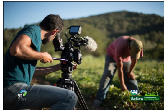
Dreharbeiten für 'Red Natura 2000'